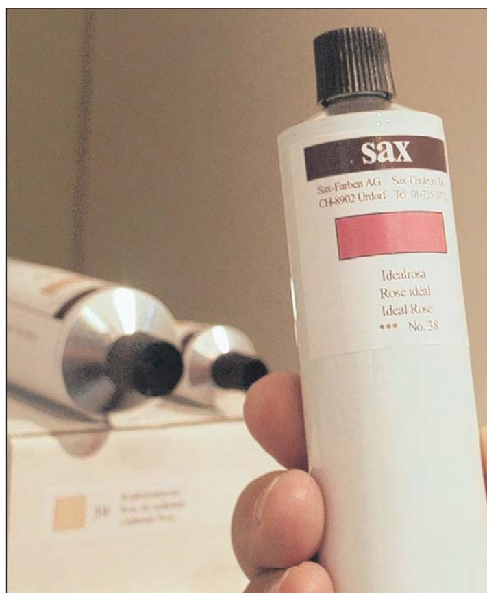
7. Die fertige Farbtube: Die Firma Sax produziert bei den Künstlerfarben rund 100 Farbtöne – in der Regel auf Bestellung