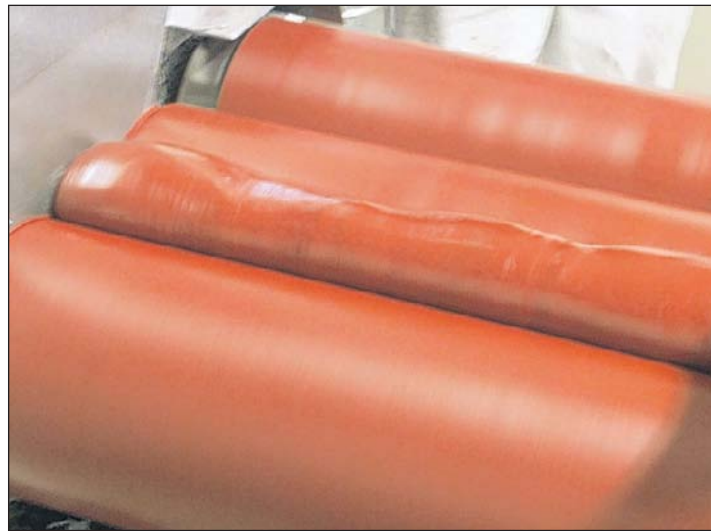
5. Glattwalzen: Der Farbteig wird zu einer homogenen Masse