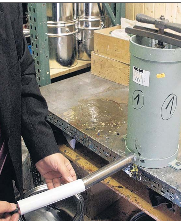
6. Das Abfüllen: Die Farbe wird von der Eisenpresse in die Tube gefüllt, die dann verschlossen und mit einer Etikette versehen wird