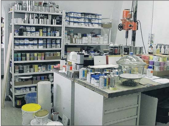
1. Das Labor: Hier werden Farbtöne entwickelt und Rohstoffe geprüft