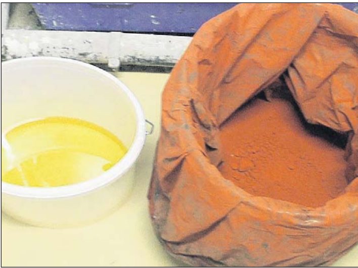
2. Was die Farbe ausmacht: Leinöl (l.) und echte Pigmente