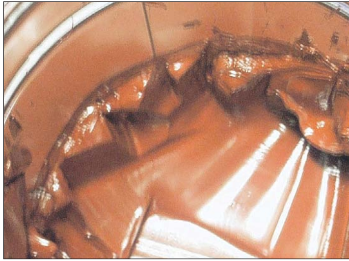
3. Der Farbteig: Wird in einer Knetmaschine hergestellt